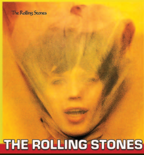
THE ROLLING STONES