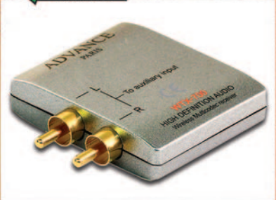
ADVANCE ACOUSTIC WTX-700

FDS - #10 - ISSN 1121-5313 0.0296 A 9 771121 531001 Prima immissione 10-10-2010 MENSILE dal 1991 OTT 20 7,00€