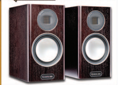
MONITOR AUDIO Gold 100 5G